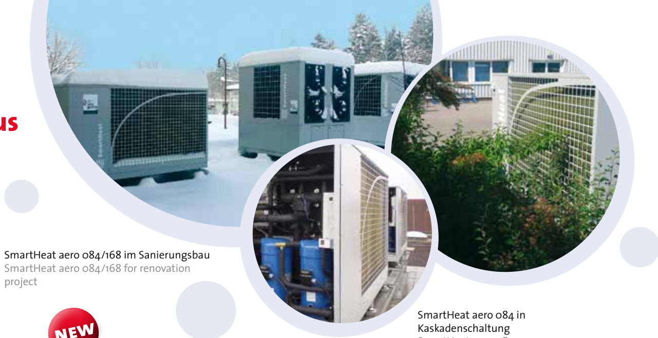
SmartHeat aero o84/168 im Sanierungsbau SmartHeat aero o84/168 for renovation project