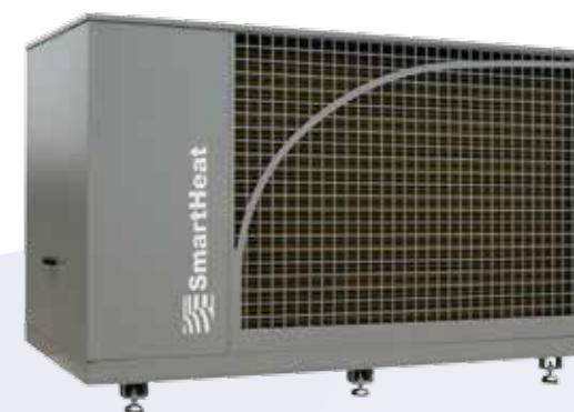
aero plus 088