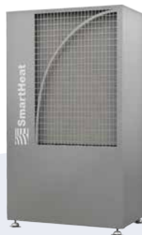
aero plus 044